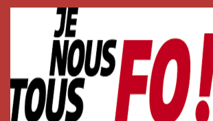
Grazia VENDRA DSDEN 38